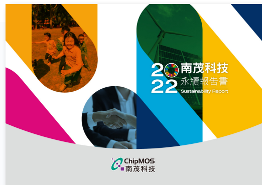
▲ 2022年南茂永續報告書