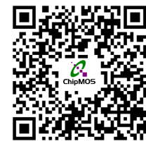
南茂官網企業永續專區